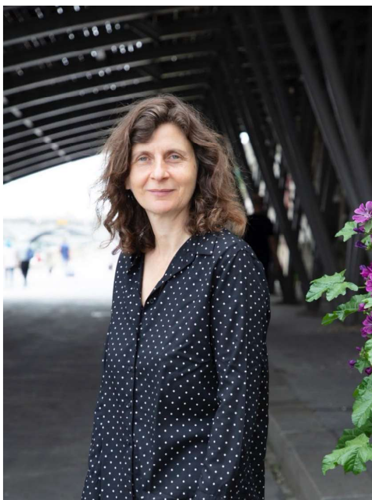
FIG. 1. Portrait d'Olivia Rosenthal