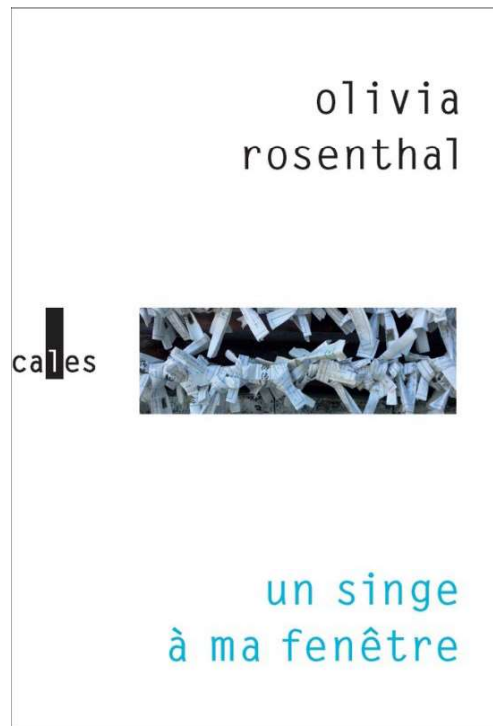
FIG. 2. Olivia Rosenthal, Un singe à ma fenêtre , Paris, Verticales, 2022.